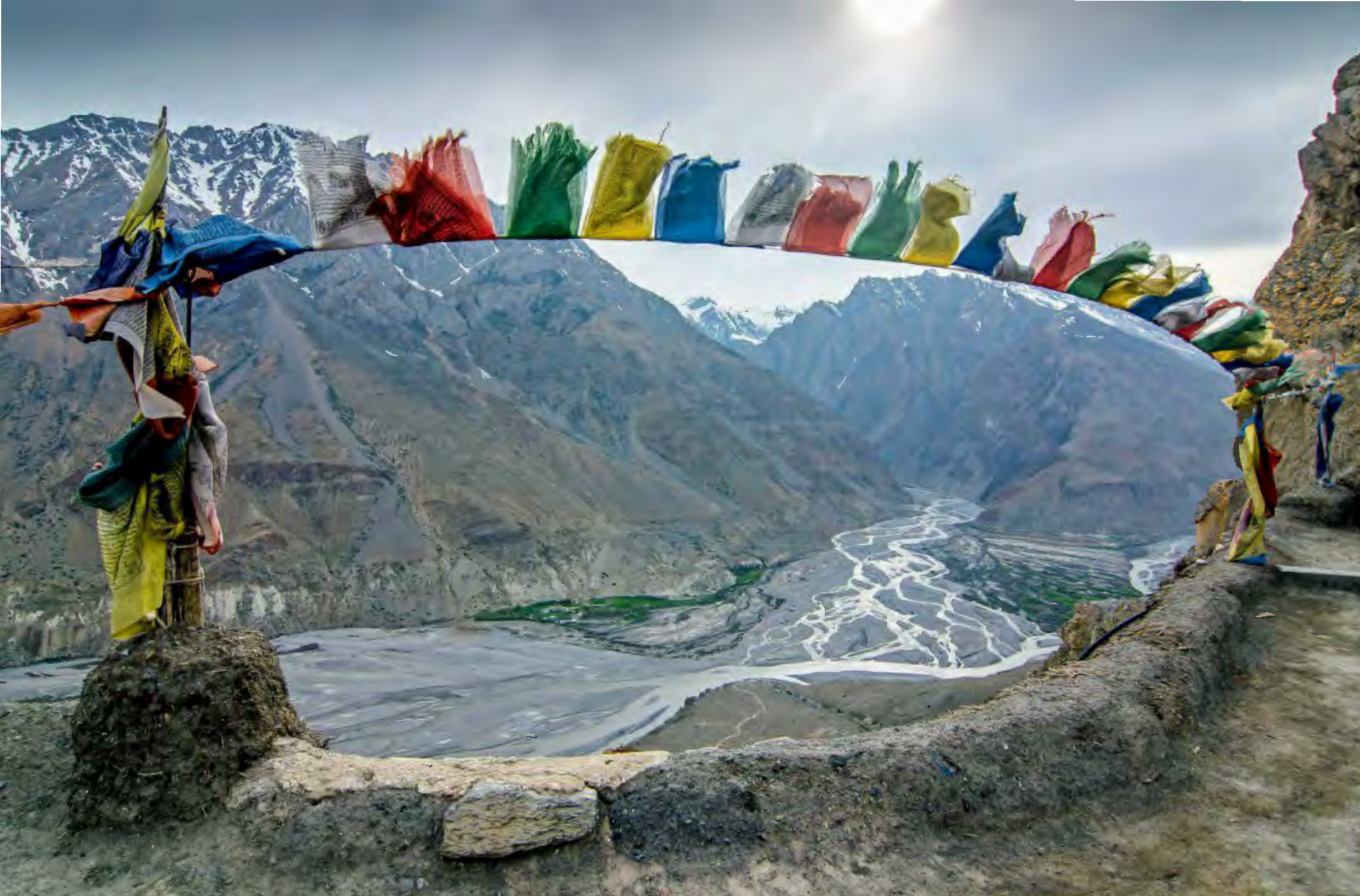
La rivière Spiti depuis le toit du monastère de Tashi Choling, à Dhakar.